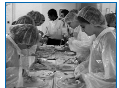
Les élèves de 3 ème du Collège St Louis en activité dans les ateliers de la section Mode et du Lycée hôtelier.

Ce temps passé entre lycéens et collégiens est souvent riche dans les échanges, et est une aide supplémentaire pour choisir une orientation.