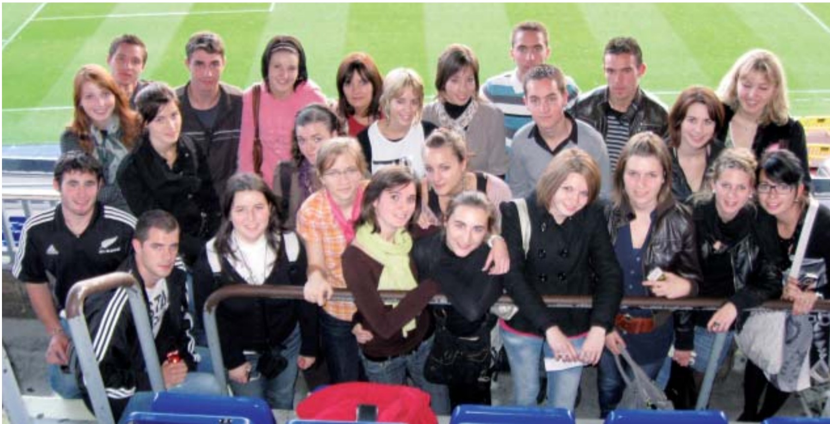
Les jeunes dans les mythiques tribunes du Camp Nou, le stade 5 étoiles (classement UEFA), où évoluent les vedettes du Barça, les Messi, Ibrahimovic, Keita et Henry.