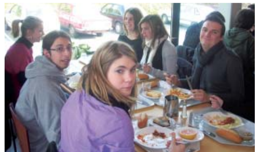
Les jeunes qui suivent des formations supérieures au Roc ont le statut d'étudiant. Pour se restaurer, ils bénéficient du ticket « U ».

Nouveau statut (adieu celui de lycéen), nouvel établissement, nouvelle vie. Voici quelques repères pour vous aider à appréhender votre nouvelle vie étudiante.