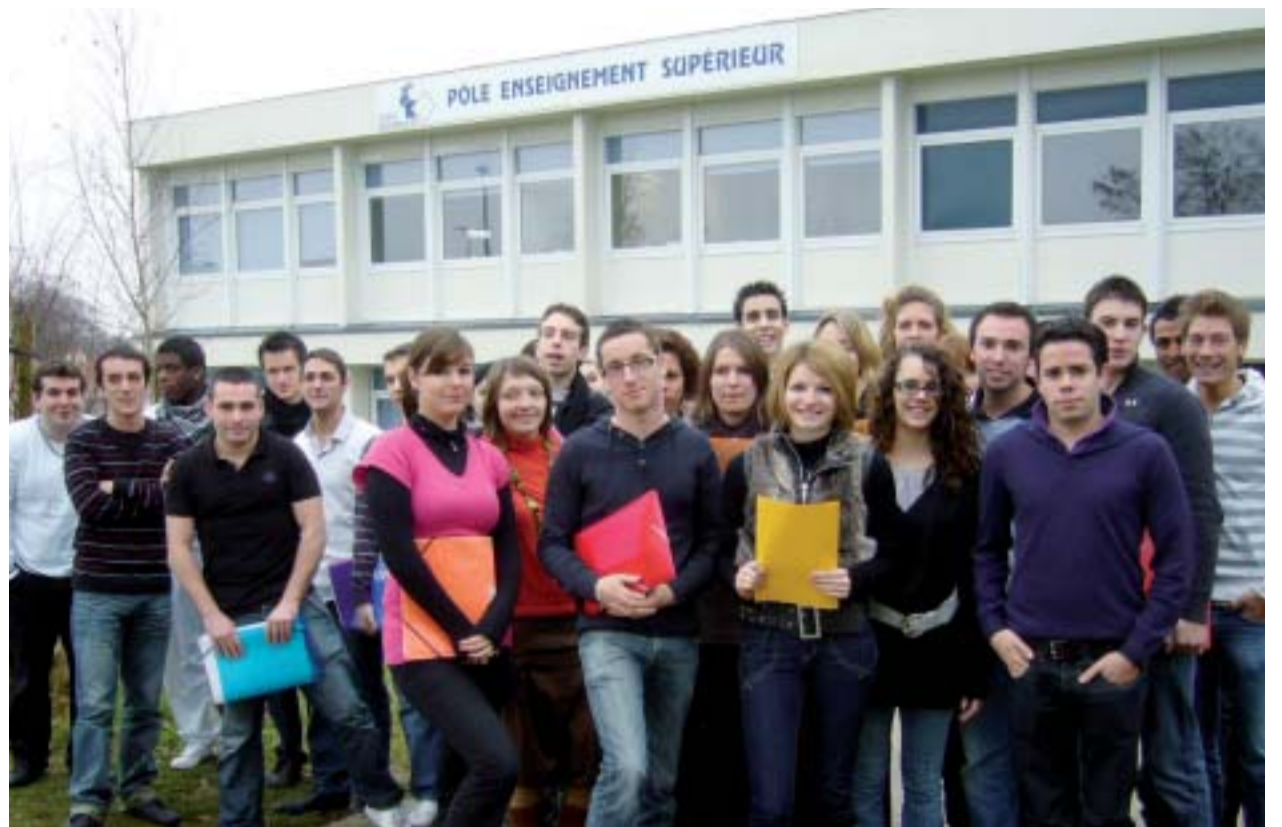
Le Pôle enseignement supérieur du lycée Notre-Dame-du-Roc dispose de sa propre structure. Près de 450 jeunes y vivent leur parcours d'étudiant, dont 340 en formation initiale.

- une formation complémentaire d'un an après un bac + 2 Finances des collectivités locales , afin d'intégrer les métiers de la gestion des collectivités territoriales. • Les métiers de l'assistance administrative proposent : - le BTS Assistant de manager , préparant des assistant(e)s trilingues. - le BTS Notariat , pour les jeunes désireux de s'engager dans cette voie juridique. - le BTS Assistant de gestion réalisé dans le cadre de l'alternance. Des formations de Secrétariat spécialisé (médical, commercial ou comptable) sont possibles en formation professionnelle. • La préparation aux métiers de la vente est possible via : - le BTS Négociation relation clients , qui peut être préparé soit en formation initiale, soit en alternance. - le BTS Technico-commercial Commercialisation de Biens Industriels, pour des étudiants issus d'une formation industrielle. - le BTS Management des unités commerciales , réalisé dans le cadre de l'alternance. Trois DEES, Diplôme européen d'études supérieures , formations en un an après un bac +2 préparent les étudiants à exercer les fonctions de conseiller de clientèle en banque ou assurance. • Dans le domaine informatique, le lycée prépare : - le BTS Informatique de gestion option Développeur d'applications .