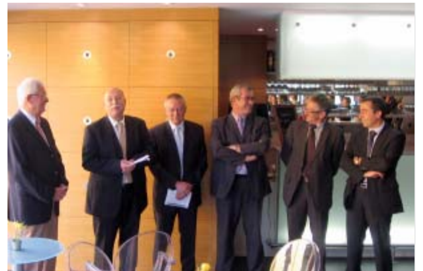
Le Pôle enseignement supérieur entretient des liens étroits avec le milieu professionnel, confortés par des rencontres au siège de l'établissement.

Le Pôle enseignement supérieur cultive des liens quotidiens avec les milieux professionnels, assurant, de ce fait, un enseignement au plus proche des activités économiques. Au cours d'interventions et de visites, les notaires, inspecteurs des impôts, géomètres, généalogistes, urbanistes, responsables commerciaux, experts-comptables, commissaires aux comptes se relayent auprès des étudiants de BTS pour présenter les aspects fondamentaux de leur métier. Les professionnels sont aussi associés à la formation par l'accueil des étudiants en stage, ce qui donne aux formations une réalité ancrée dans la pratique quotidienne. Des rencontres