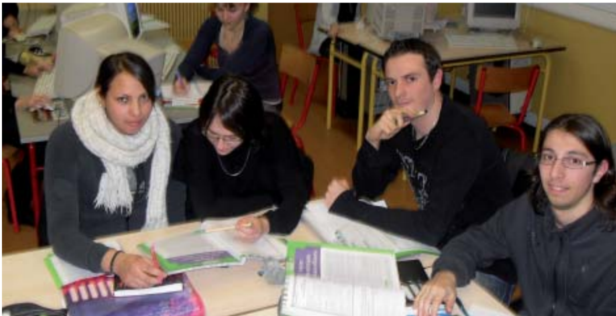
L'assistant(e) de manager a une position centrale dans l'organisation. Il joue un rôle d'interface dans l'entreprise, au carrefour des services.

Le BTS Assistant de manager, mis en place au lycée Notre-Dame-du-Roc en septembre 2008, résulte d'une fusion des BTS Assistant de direction et BTS Trilingue.