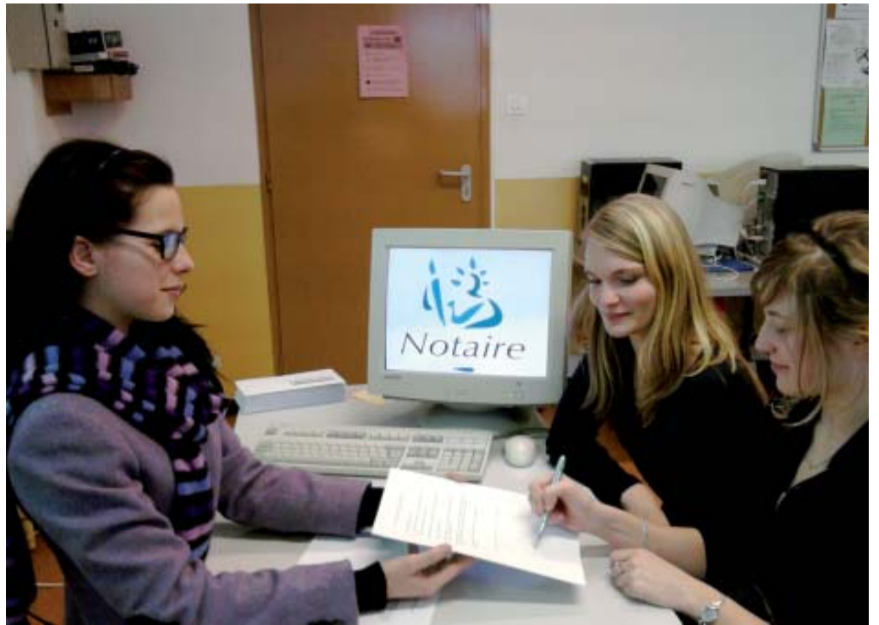
Les futurs diplômés deviendront collaborateurs de Clercs et de notaires.

Les cours sont complétés par sept semaines de stage dans un office notarial en première année et cinq semaines en deuxième année. En outre, les étudiants de première année vont chaque vendredi en stage, dans un office notarial : « Ces périodes de stages nous permettent de mettre la théorie apprise en cours en pratique