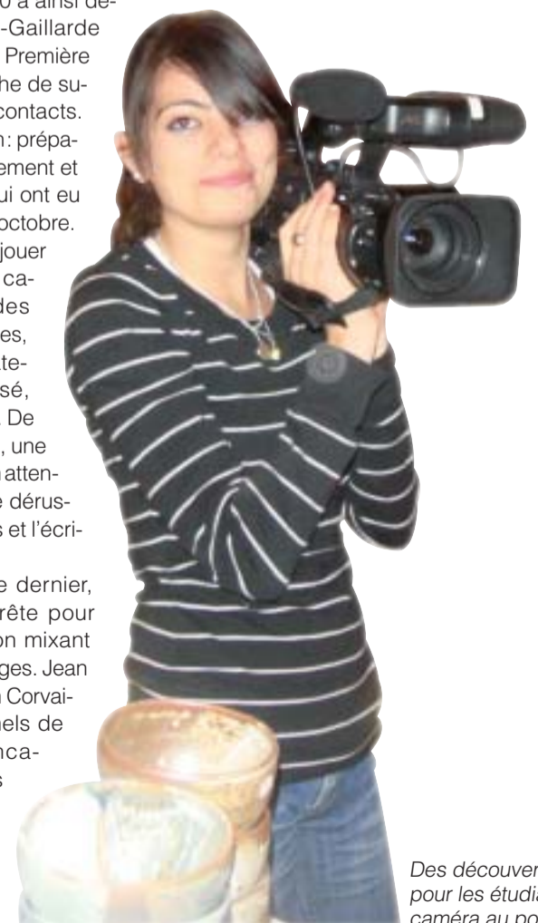
Des découvertes pour les étudiants, caméra au poing.

Les BTS Comptabilité et gestion des organisations 1.