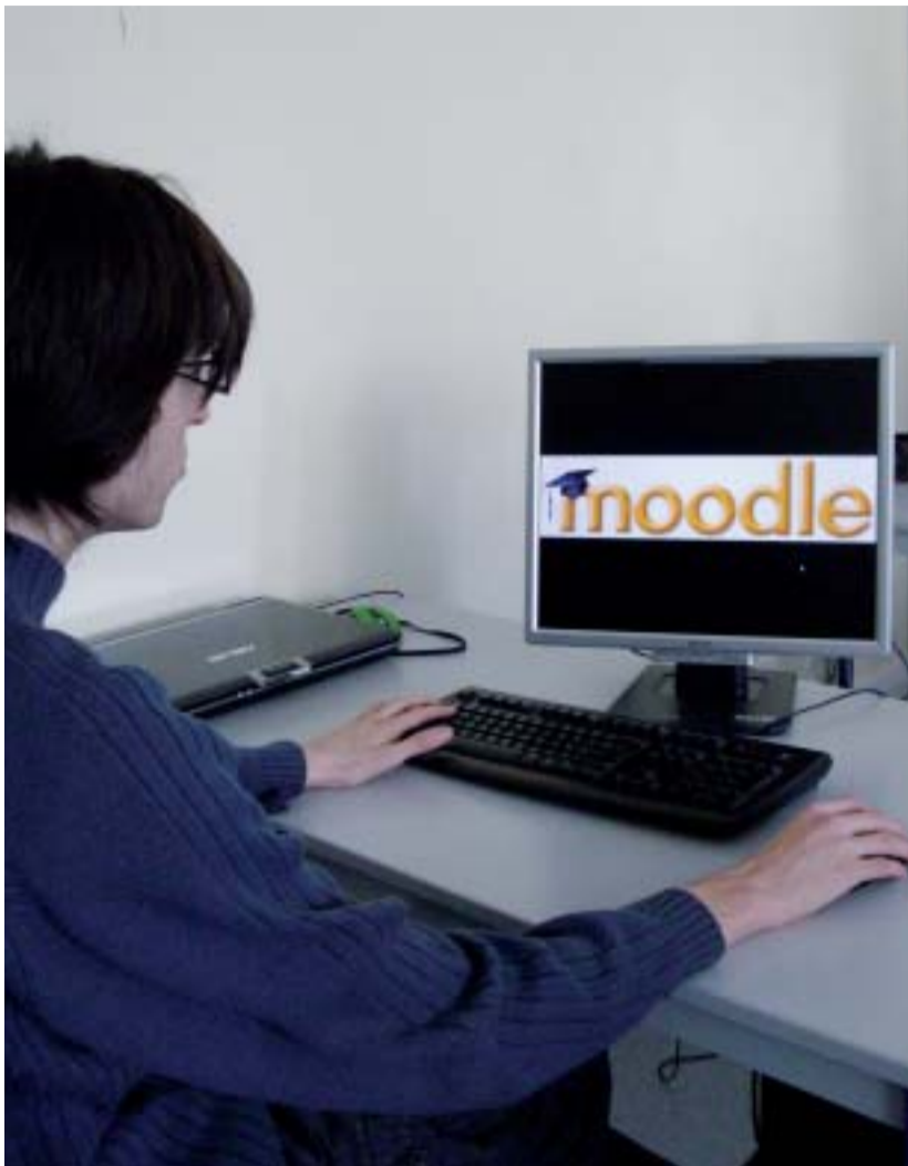
Moodle, l'outil qui aide à en savoir plus et à échanger entre tous.

Depuis 2008, la plate-forme collaborative « Moodle » est accessible aux étudiants du brevet de technicien supérieur Informatique de gestion. Elle a été généralisée à l'ensemble du Pôle de l'enseignement supérieur, ainsi qu'aux terminales Gestion des systèmes d'information, au début de l'année 2009.