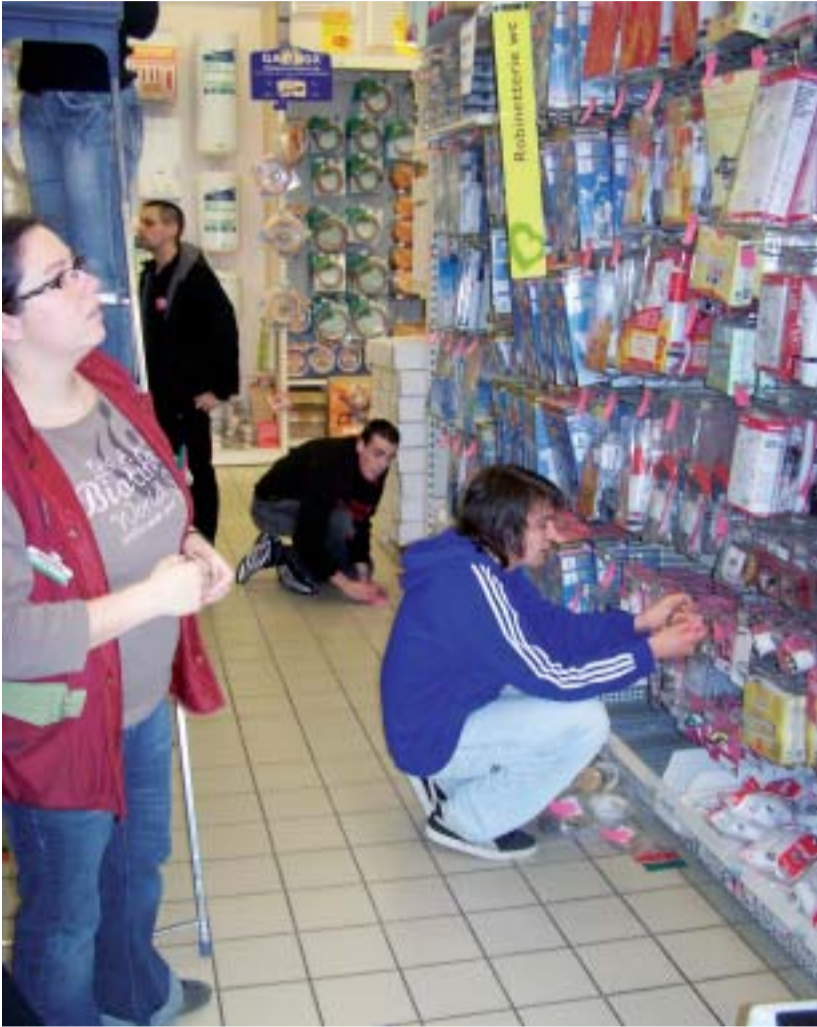
Une armée d'étudiants a envahi les rayons du magasin. Pas question de se tromper dans l'inventaire.

On dirait une chanson à la Dutronc. La Roche s'éveille. Il est 5 h 45. Comme à chaque début d'année civile, les étudiants de première année issus des nombreuses formations du lycée Notre-Dame-du-Roc viennent effectuer l'inventaire au magasin M. Bricolage des Flâneries, à La Roche-sur-Yon. La suite d'une déjà longue histoire.