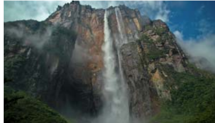
La chute du « Salto Angel », on ne fait pas mieux à la surface du globe.

Le Venezuela, ou « Tierra de Gracia » , est découvert en 1498 par Christophe Colomb. Le pays passe sous domination espagnole vingt-neuf ans plus tard. Une présence qui durera jusqu'en 1811, année de l'indépendance vénézuélienne. Le pays possède des frontières avec la Colombie à l'Ouest, le Guyana (ancienne Guyane britannique) à l'Est, le Brésil au Nord. Toute sa côte Nord borde la mer des Caraïbes. Le Venezuela est un important pays producteur de pétrole. C'est aussi l'un des membres fondateurs de l'OPEP (Organisation des Pays Exportateurs