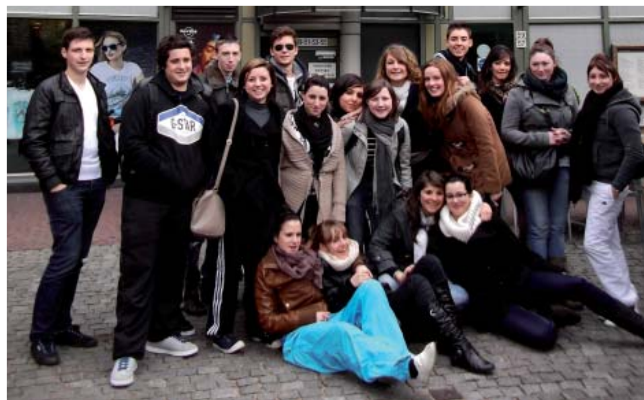
Le déplacement à Amsterdam, un voyage que les TPC1 n'oublieront pas

Le lycée tertiaire est toujours en mouvement et prend part, chaque année, à plusieurs événements et projets, dans le but de permettre aux élèves d'acquérir de nouvelles compétences professionnelles.