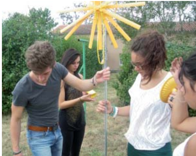
Souvenir de la journée d'intégration. L'occasion, par les activités, de mieux se connaître.

Les élèves de la section Mode poursuivent leurs découvertes autour du monde et leur ouverture aux autres. Barcelone et les compagnons d'Emmaüs sont les premiers thèmes phare d'une année, comme toujours, riche en événements.