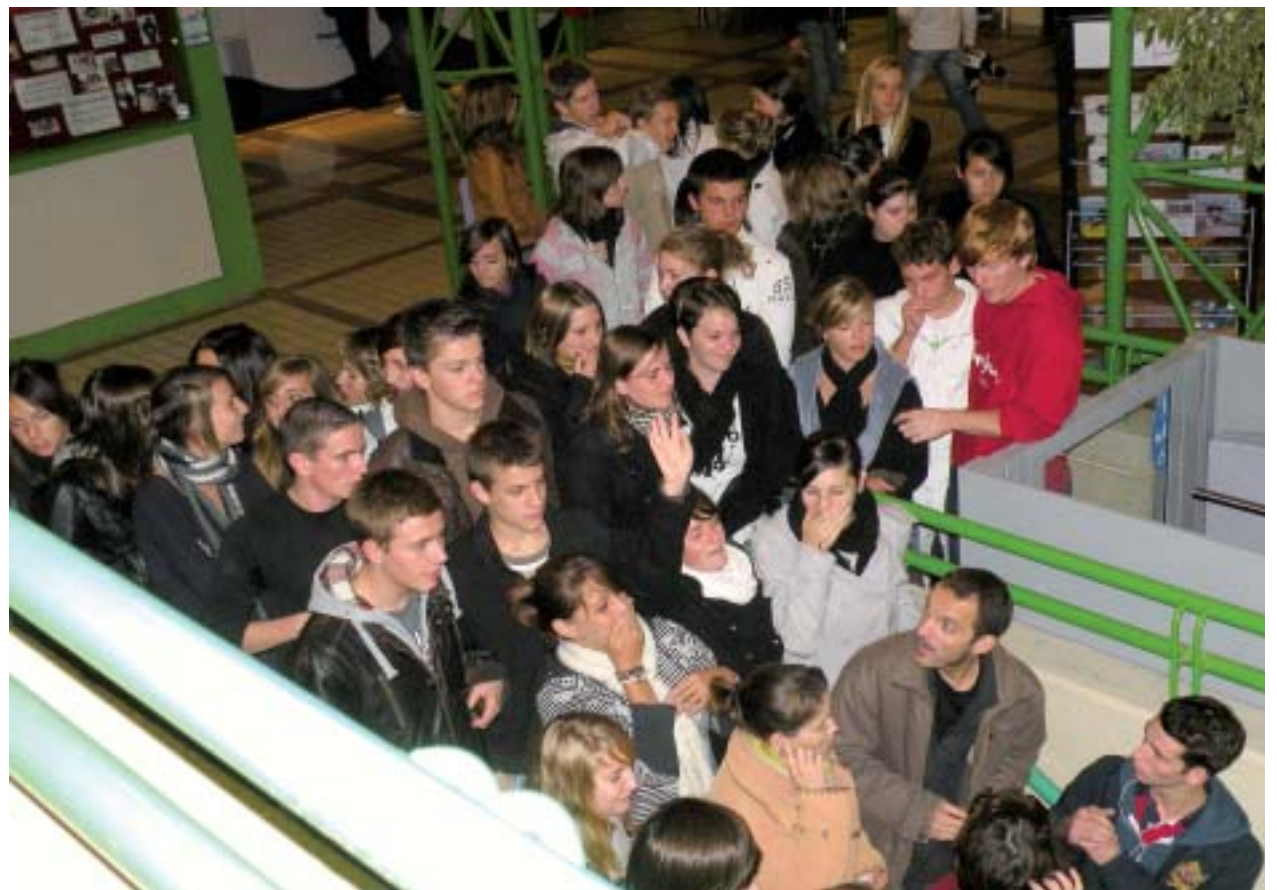
Le mardi 6 octobre, une sortie à la patinoire était organisée avec les lycées Saint-Louis et Saint-Joseph.