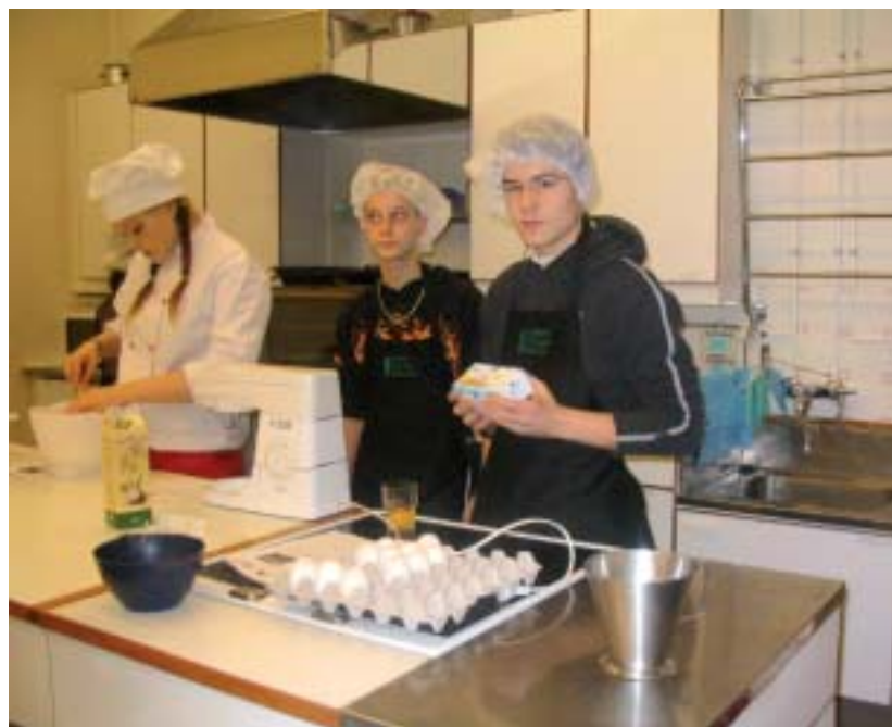
Les stages permettent de découvrir une autre culture... gastronomique. Ici en Finlande.