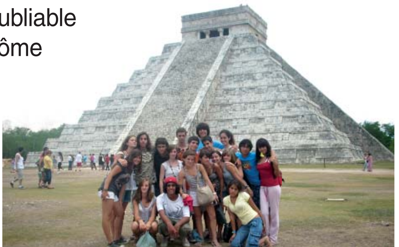
Les correspondants français et mexicains à Chichén Itza.

Entre les cours à l'ECAB (l'école avec laquelle est réalisé l'échange) et les sorties entre correspondants, quelques visites s'imposaient. Cancún se situe dans la région où vivaient les Mayas, population antique qui s'est éteinte vers le XV e siècle, peu avant l'arrivée des Conquistadors espagnols. Il reste des vestiges « magnifiques » de cette culture. Les élèves français ont donc visité en compagnie de leurs correspondants Chichén Itza, ancienne ville Maya : « C'était très impressionnant ». Autre site archéologique incontournable, celui de Tulum, « un des plus beaux endroits ». Il contient les restes d'une ville Maya datant du VI e siècle surmontant une plage « magnifique, qui donnait l'impression d'être dans un rêve ». D'autres sorties ont également été au programme : Xel Ha, un parc naturel « très beau et sympa », proposant différentes activités comme nager dans une rivière : « On a fait la guerre aux moustiques, mais ils nous ont battus ».