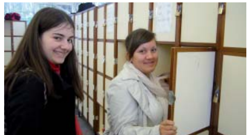
Le Dalot a été fermé, permettant l'installation de casiers.