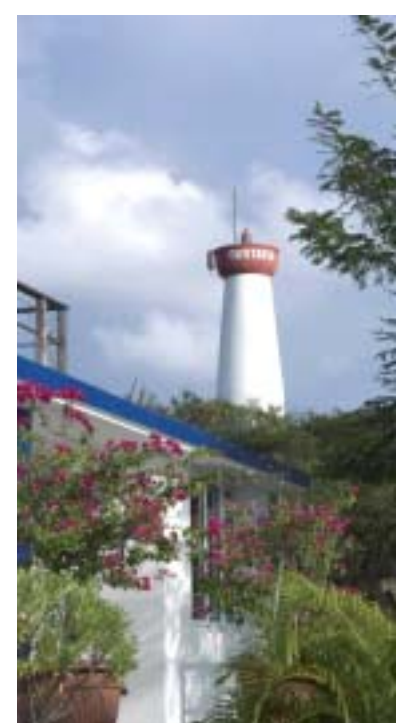
Phare de Gustavia (le plus grand quartier de l'île).

tuer au rythme scolaire du lycée, plus de travail et plus de difficultés. Enfin, tout de même, leur joie d'être ici est visible. Ils sont heureux du lycée où ils se sont sentis bien accueillis : « Il y a une très bonne ambiance, surtout à l'internat ».