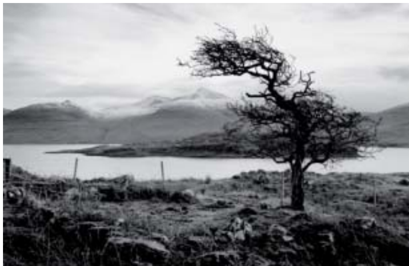
Carl White : des images en noir et blanc qui invitent au voyage.

Dès le mois de décembre, comme le veut la tradition, un artiste interviendra au sein du lycée. Le photographe anglais Carl White sera le premier à exposer. Il viendra sûrement lui-même présenter son travail au cours d'un vernissage au début du mois. Carl White retrace à travers sa photographie en noir et blanc un réel parcours historique du climat et nous incite au voyage par la force de ses paysages. À l'extérieur du lycée, deux expositions sont à découvrir. Tout d'abord, à La Roche-sur-Yon : la série photographique Fables par Karen Knorr. Cette artiste mène un travail basé sur le rapport de l'homme à l'animal et troublera le spectateur par les lieux qu'elle photographie, mêlant patrimoine historique et animaux. L'exposition a lieu jusqu'au 9 janvier au musée municipal.